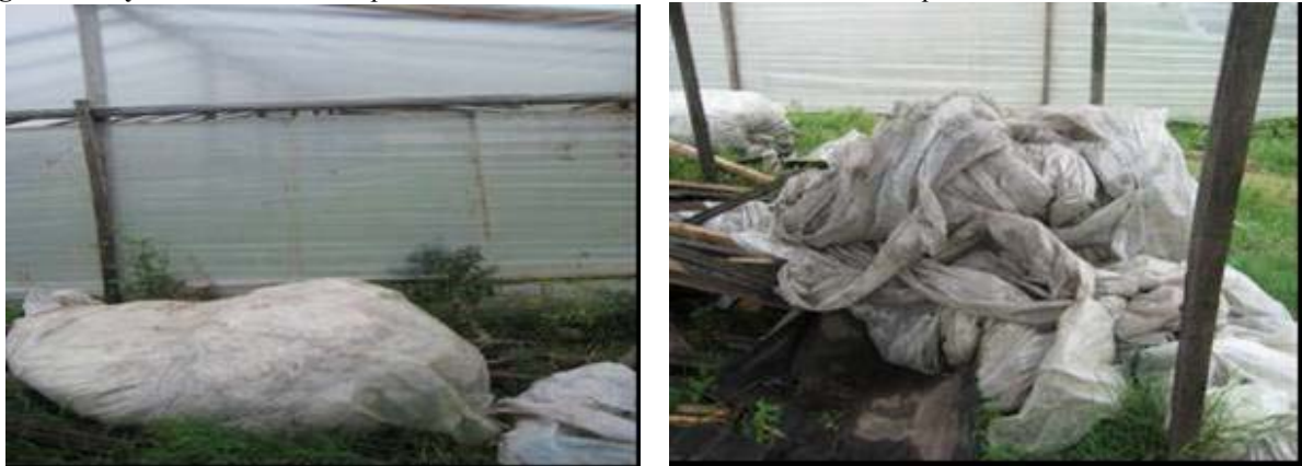
Figuras N°3 y 4: Acumulación de plásticos de invernáculos en los rincones de las quintas.

Estas prácticas no supondrían un grave problema ambiental ni sanitario si no se hubiese incrementado considerablemente la superficie ocupada por invernaderos.