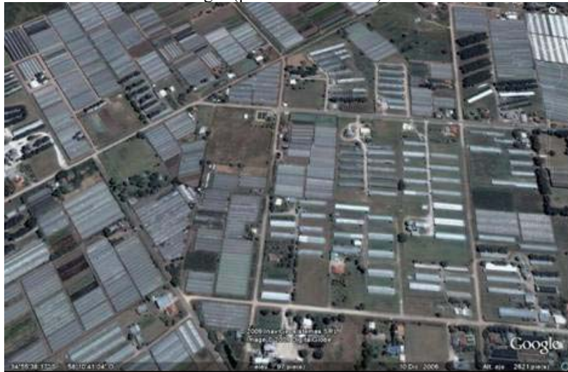
Figura N°5. Imagen satelital de la zona El Peligro (partido de La Plata) tomada en Diciembre del 2006.