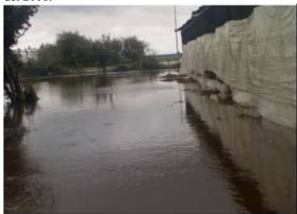
Figuras N°7 y 8. Fotos tomadas luego de una intensa precipitación en la zona de Hudson (Buenos Aires) en Febrero del 2008.

En cuanto a la problemática de la impermeabilización del agua de la lluvia que generan los invernaderos, y tomando la superficie bajo cubierta relevada en el 2005 (775has), podemos hacer los siguientes cálculos. Por caso, 1mm de agua de lluvia representa en una hectárea a 10 m 3 de agua (1m 3 es equivalente a 1000 litros). Por ende, los 1015mm de lluvia promedio anual en la zona de la capital bonaerense hacen que un total de 7.866.250m 3 deban buscar una vía alternativa de infiltración/escape. O más precisamente, una lluvia intensa de agua de unos 40mm en La Plata en el 2005 implicó que 310.000.000 litros no puedan infiltrarse. El anegamiento, la dificultad de circulación, el deficiente sistema de drenaje, el desregulado e impetuoso crecimiento de la superficie bajo cubierta genera una complicación, no sólo los días de lluvias, sino que su normalización demanda cada vez más tiempo (Ver Figuras N°7 y 8).