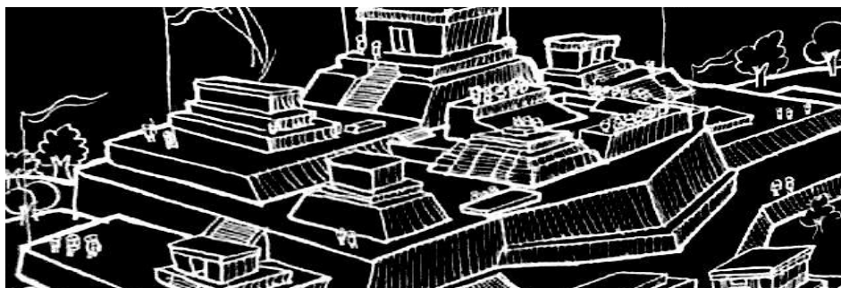
Theomai 27-28 · Año 2013

Perspectivas diversas sobre la problemática territorial y urbana