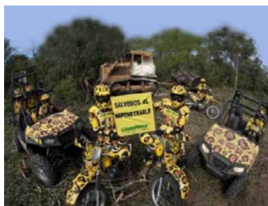
Desmontes en El Impenetrable.