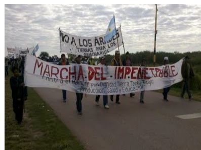
Marcha de los Pueblos, y acampe en la Plaza 25 de Mayo de Resistencia. Agosto de 2006.