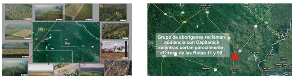
Desmontes en El Impenetrable y Acciones Civiles de los PPOO.

En el mes de mayo de este año el gobierno de la provincia dictó una resolución mediante la cual suspendió por 60 días los aprovechamientos silvopastoriles en bosques nativos clasificados en la Categoría II (amarillo). La misma fue el resultado de la reunión entre el gobernador Jorge Capitanich y representantes de Greenpeace, luego de que la organización ambientalista bloqueara dos topadoras que estaban desmontando en El Impenetrable con permisos otorgados por la provincia violando la normativa nacional.