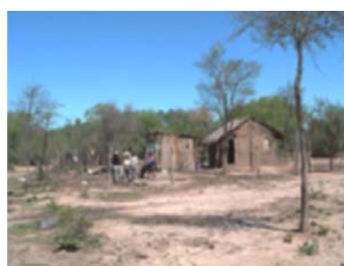
Vivienda PPOO en sitios y entorno degradados, desforestados, con suelos erosionados.