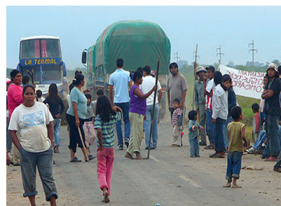
Manifestaciones de resistencia indígena. Cortes de rutas en el interior provincial.